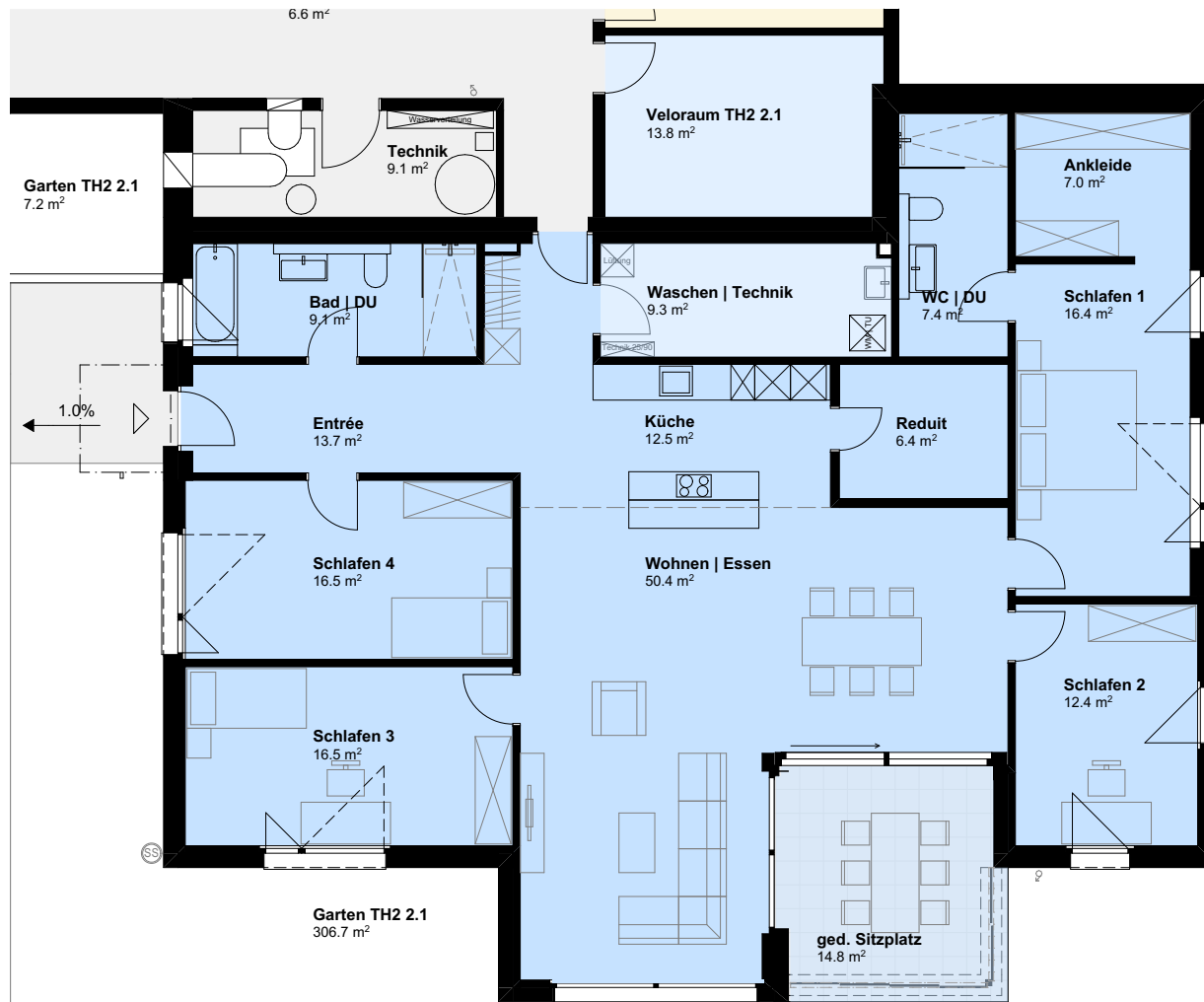
Grundriss Erdgeschoss, 5.5 Zimmer